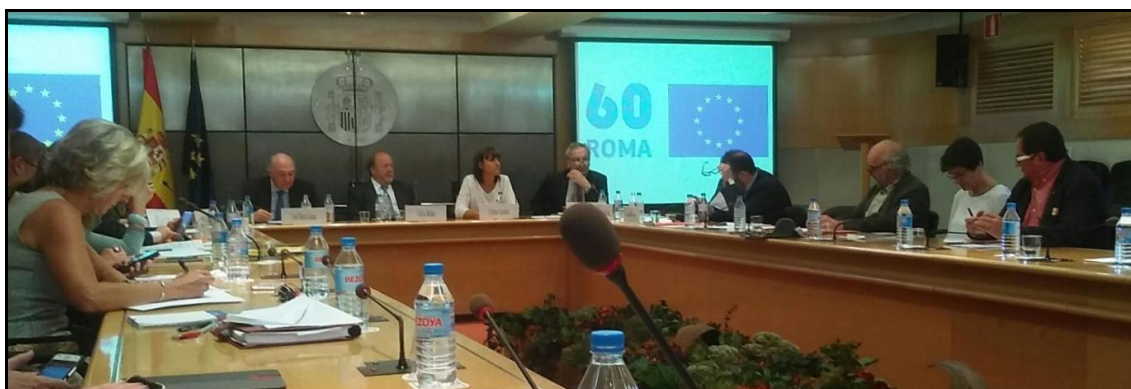
En la sede del CES de España ayer se debatió a cerca del "Libro Blanco sobre el futuro de Europa"