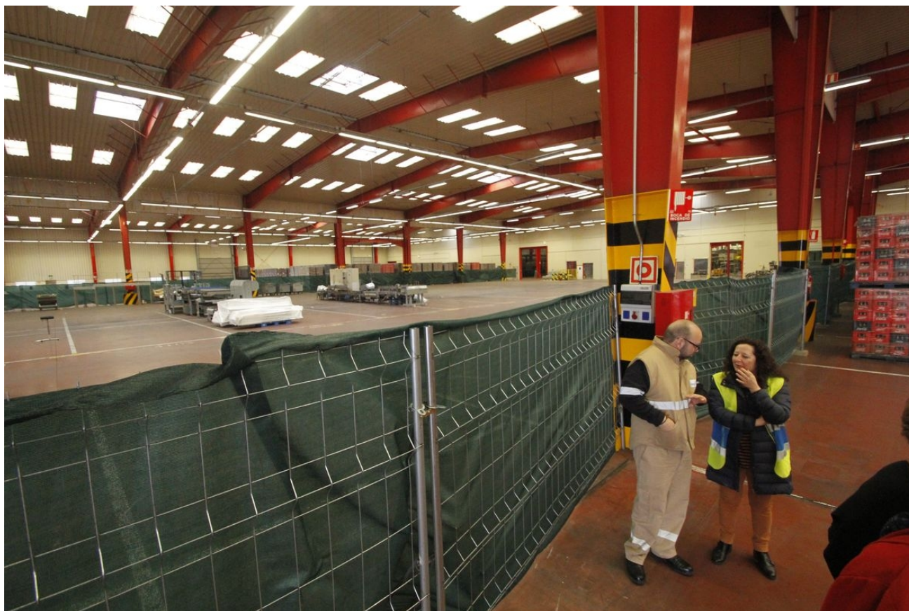
Almacén regulador vacío de producto y reservado con vallas para las instalaciones que están desmontando

DEPARTAMENTO ALMACÉN REGULADOR- Según el Manual de Organización COIL, es el almacén regulador central para el resto de las plantas de producción por su situación estratégica en el centro de la Península, (pues a día de hoy, ni existe, ni esta creado, ni recibe ese volumen tan importante que se ha descrito en el Informe de la Inspección, hay una actividad de unos 4/5 camiones al día de producto, cuando la actividad del mercado de la zona centro en relación a la descripción de almacén central estratégico, requerirá estar movilizándolo una media no inferior de 50 camiones diarios.) Tiene asignados 25 trabajadores de los 35 previstos según el manual de Organización. Carece de actividad en febrero a fecha de la visita de la Inspección de trabajo, y su tarea es la eliminación de 15.000 palets de producto caducado. Solo existe una mínima actividad en ese marzo de unos camiones de prueba, que se descargan y se vuelven a cargar, sin registros de trazabilidad y registros de control por parte de los trabajadores, no existe herramientas para la codificación, localización y control en el almacén de la carga y descarga de los camiones. Las instalaciones carecen de señalización para el almacenaje. Los operarios carecen de lectores ópticos, ni etiquetas tan solo disponen de las carretillas elevadoras.