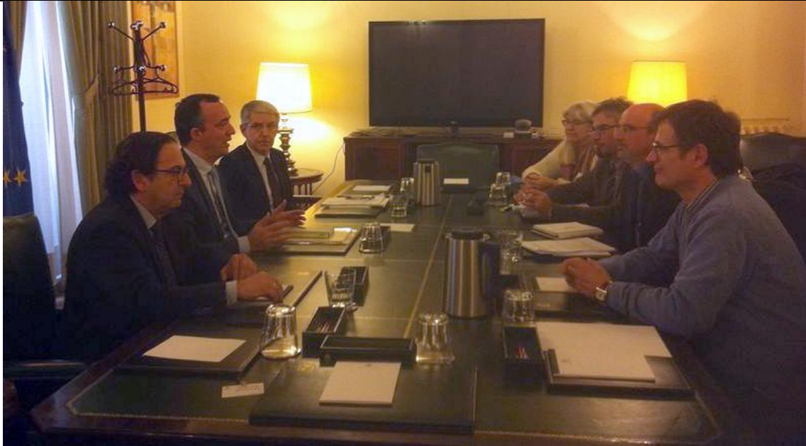
Ley de Seguridad Ciudadana: CCOO y UGT se reunieron ayer con el Grupo Popular

Nº 149 / Año III – Viernes, 30 de enero de 2015