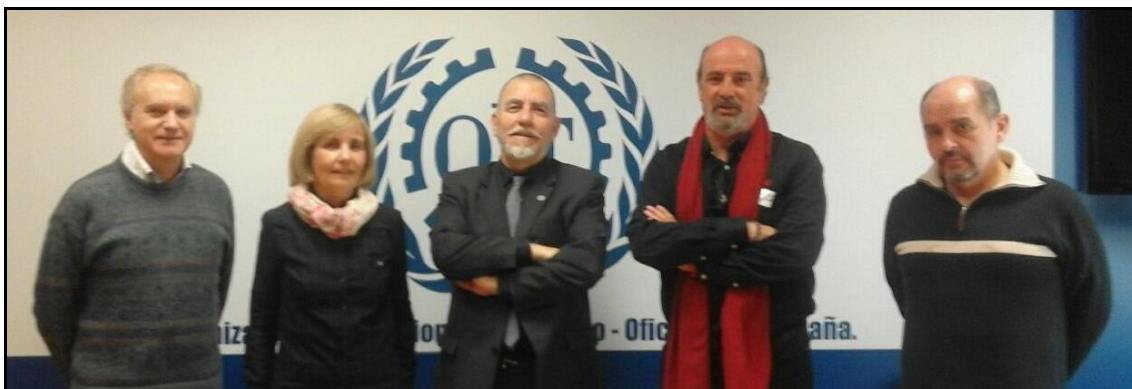
#NoMásCortesDeLuz - CCOO y otras organizaciones ciudadanas denuncian la situación ante la OIT