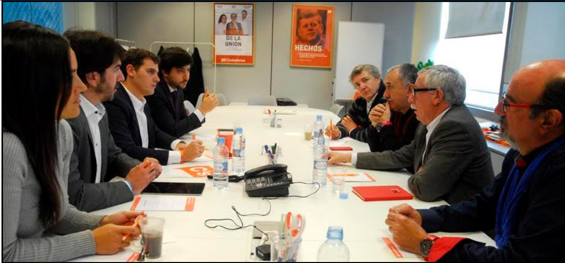
CCOO y UGT comparten con Ciudadanos sus prioridades sindicales y sus próximas movilizaciones