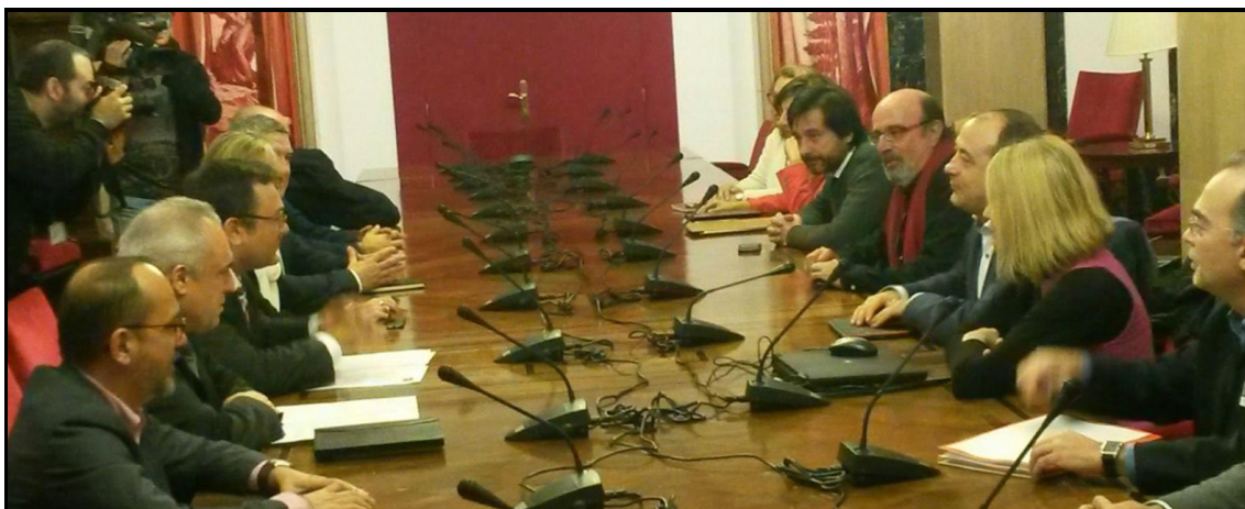
CCOO y UGT abordan en el Congreso con los grupos políticos el tema de las pensiones