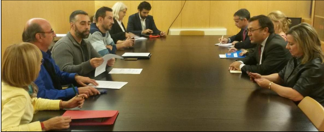
La plataforma #NoMásCortesDeLuz presenta su manifiesto al Grupo Socialista