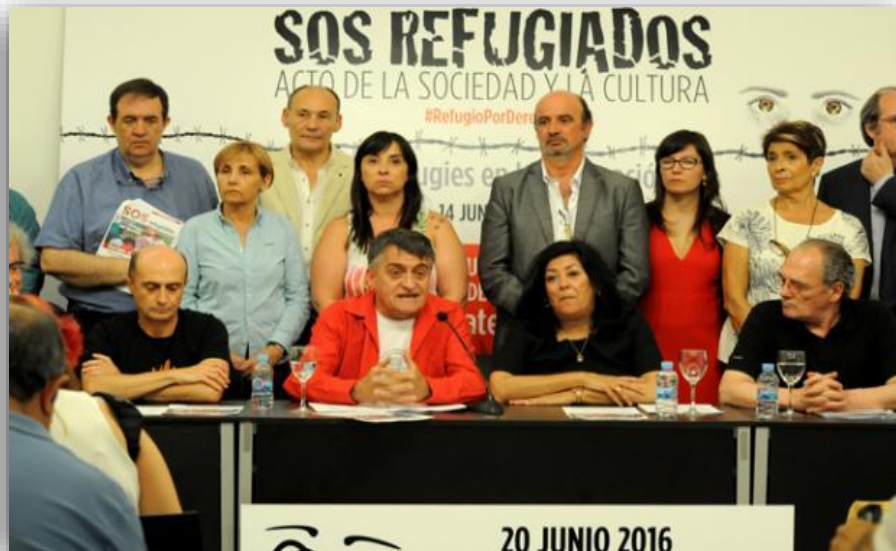
Rueda de prensa en el Círculo de Bellas Artes