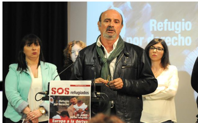
Presentación del manifiesto de apoyo a los refugiados - 11/5/2016