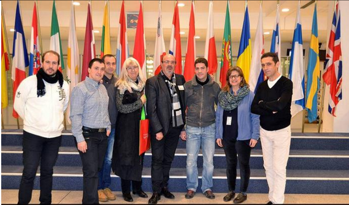
Una delegación de cinco representantes de CCOO de la empresa de Campofrío, visitan a eurodiputados en el Parlamento Europeo para pedirles que vigilen el cumplimiento de los acuerdos con Campofrío. En la imagen junto a la eurodiputada de IU, Paloma López

Nº 150 / Año III – Viernes, 6 de febrero de 2015