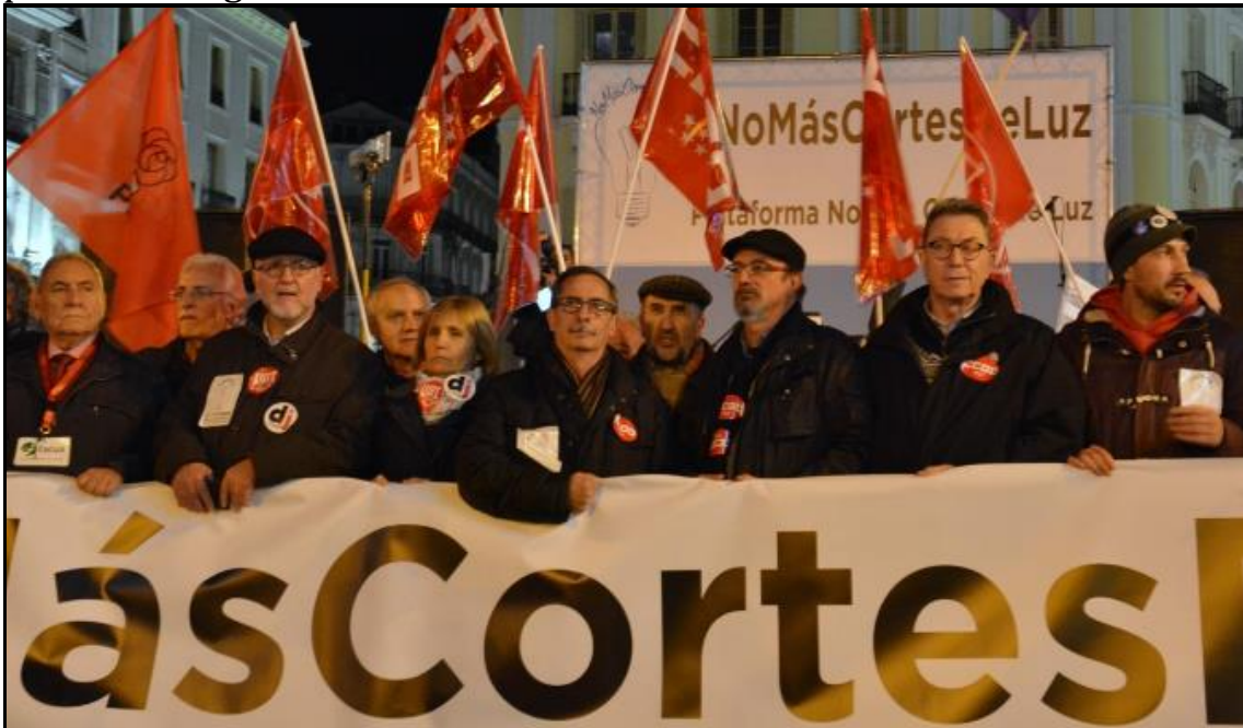
#HoyApagón21D – CCOO estuvo junto a otras organizaciones ciudadanas en las movilizaciones

La movilización ciudadana ha impulsado las primeras medidas contra la pobreza energética