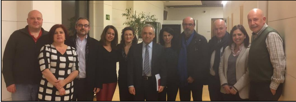
Proposición de Ley Subcontratas - CCOO y UGT se reúnen con el Grupo Socialista en el Congreso