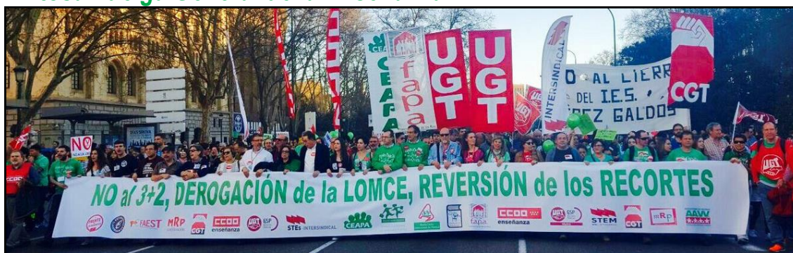
Manifestación de la Enseñanza en Madrid