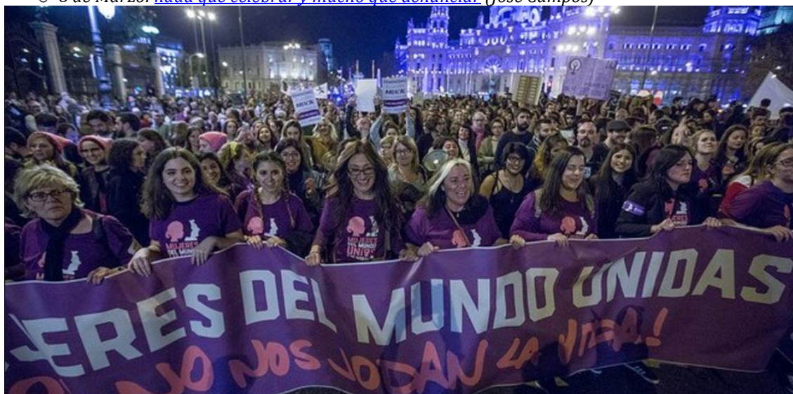
Las calles se tiñeron de morado

o 8 de Marzo: nada que celebrar y mucho que denunciar (José Campos)