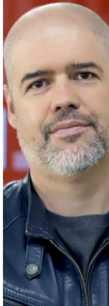
Unai Sordo. Secretario general de CCOO

“El poder de negociación sindical, ha advertido Unai Sordo, es la clave para mejorar en los próximos años los salarios y los derechos de la gente que peor está en el mundo del trabajo” ■