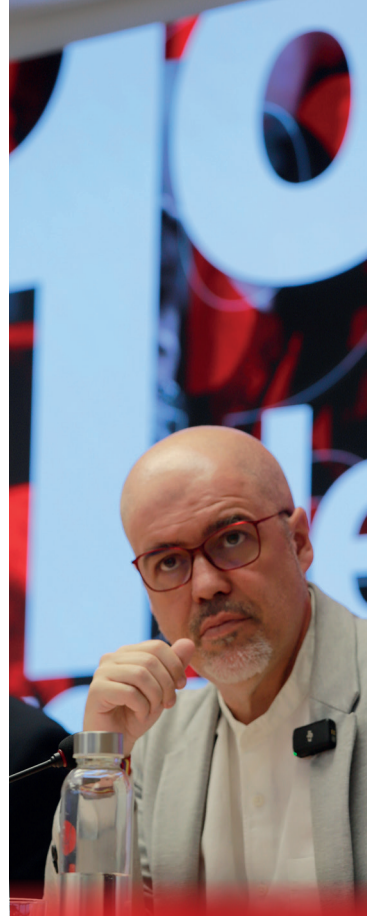
Unai Sordo. Secretario general de CCOO

Ante esta situación, los sindicatos han presentado recientemente una propuesta que contempla un paquete de medidas en materia de vivienda, entre las que destacan la ampliación del parque público de vivienda asequible, la movilización de vivienda vacía y la intervención sobre los precios en zonas tensionadas, junto a la limitación del uso especulativo del mercado inmobiliario y del impacto de la vivienda turística.