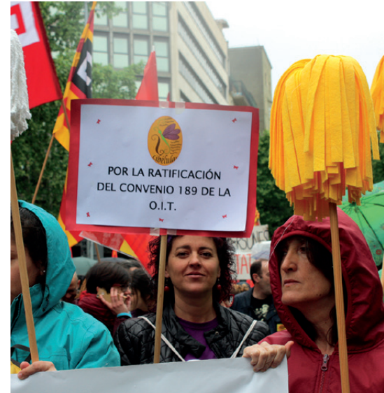
Manifestació del 1r de Maig de 2018 a Barcelona, convocada pels sindicats majoritaris