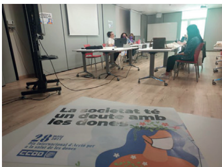
Aurora Richarte Giménez

la construcció, ambdós sectors altament masculinitzats, i se segueixen aplicant a les dones els resultats d'assaigs clínics realitzats bàsicament en mostres masculines. Ens queda encara camí, però anem avançant! ●