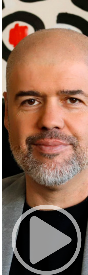
Unai Sordo Secretario general de CCOO

Desde CCOO ponemos en valor este quinto acuerdo por el que se prorrogan los ERTE y el éxito del diálogo social, desde la convicción de que va a haber una reactivación económica importante que permita recuperar los puestos de trabajo perdidos durante la crisis. ■