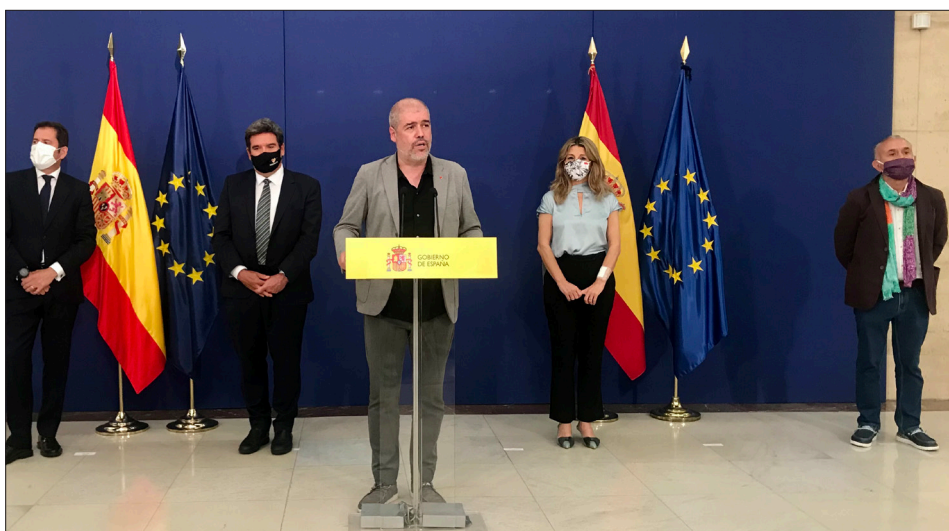
Unai Sordo, tras la firma del acuerdo de prórroga de los ERTE

“ EL ACUERDO ES UNA MAGNÍFICA NOTICIA QUE PERMITE QUE, POR PRIMERA VEZ EN LA HISTORIA, LA CAÍDA DE LA ECONOMÍA NO SE HAYA TRADUCIDO EN UNA CAÍDA SUPERIOR DEL EMPLEO